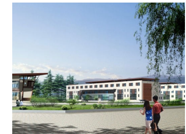
Verwaltung und Seminarzentrum