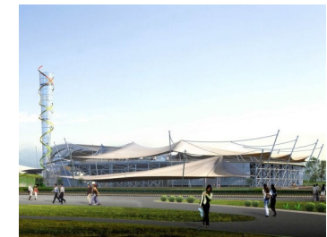
Hauptstadion von Süden