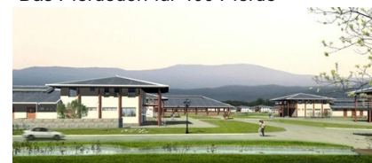
Das Pferdedorf für 400 Pferde