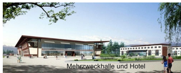
Mehrzweckhalle und Hotel