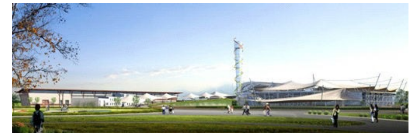
Blick auf die Mehrzweckhalle und das Stadion von Süden aus