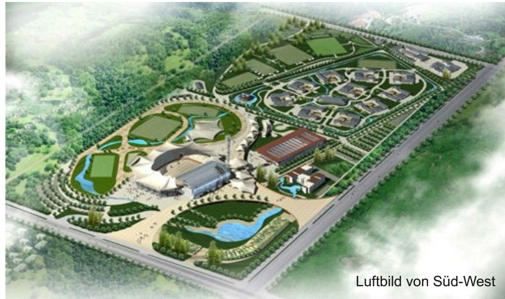
Luftbild von Süd-West

Fachplanung, Vorentwürfe und Projektleitung: Fink Planung / Aufkirchen Architektur und Städteplanung: Architekt Röhm / Schwäbisch Hall Baubiologie und Konstruktion: IB Schmidwenzl / Eichenau Architektur und Kalkulation: Architekt Shen / China-Union-Group Landschaftsarchitektur und Design: Landschaftsprofessor Xiaoming Liu Projektbetreuung und Freianlagen: Trudy Maria Tertilt Netzwerk China: Aiwu Tong-Bethig